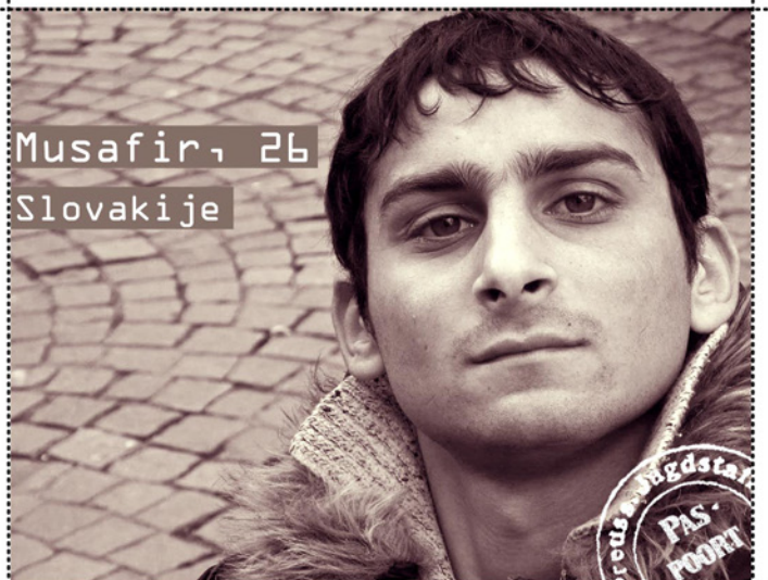
Musafir, 26 Slovakië